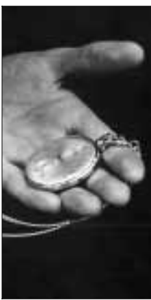
STRESS - Ny teknologi betyder, at medarbejdere kan stå til rådighed 24 timer i døgnet.